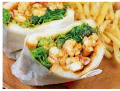
アメリカンロブスターサンド 3200円