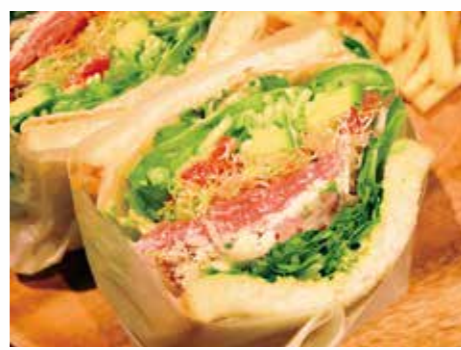
生ハムと野菜9種のベジタブルサンド 1600円