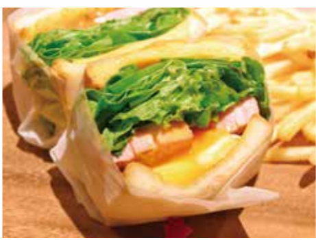
エッグベネディクトサンド 1400円

●営業時間 11:30 ~ 15:00 / 17:00 ~ 24:00 ●定休日：無休 ●お支払い方法：現金・クレジットカード各種