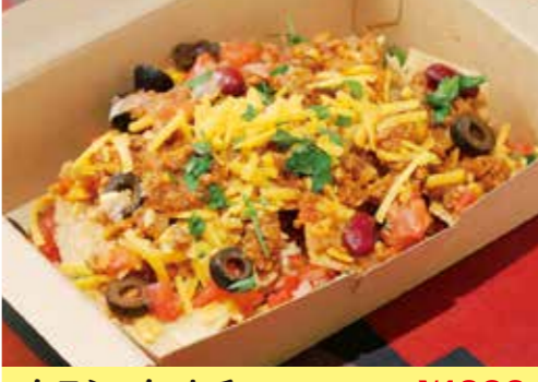
クラシック ナチョス ¥1000