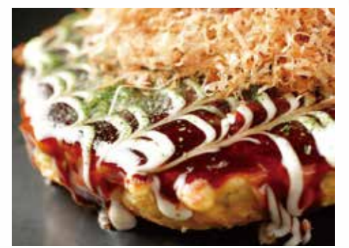
お好み焼きMIX (大盛) 1800円