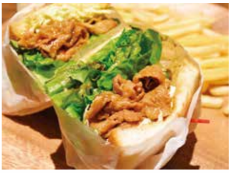
ブルコギサンド 1600円